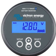
Bluetooth-Messung: BMW-712 Smart Batteriemonitor