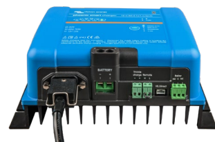
Smart IP43 Ladegerät 12/50(1+1)